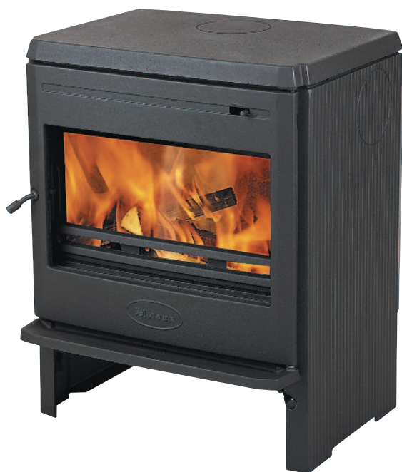
Finition fonte : 360 CB