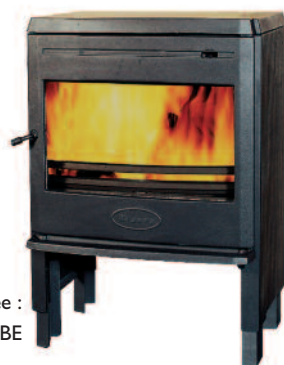
Finition émaillée : 360 CBE